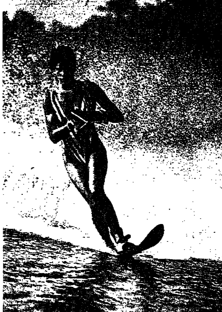
حملت سنواتها العشرين وتزلزلت فوق النضارة

قد تبدو هذه الواقعة بعيدة عن التصديق، ولكن الولايات المتحدة كانت بالفعل تعرض وتبيع تكنولوجياها المتطورة، في مجال الاسلحة في الشرق الاوسط في القرن التاسع عشر. وقد وصلت بالفعل غواصة اميركية مملوكة في صناديق الى مصر عام ١٨٧٧ وتسلمتها القادة البحرية التي اقلها الخديوي اسماعيل في رشيد ولكن لاسباب غامضة حتى الآن فيما يتعلق ببعض جوانب الصفقة لم يجر تركيب الغواصة ابدا. ويقول كاتب عن العلاقات الديبلوماسية المصرية - الاميركية خلال ١٥٠ عاما اعد احساب السفارة الاميركية ان الرئيس اندرو جاكسون عين جون غليدون في عام ١٨٣٥ قنصلا للولايات المتحدة في الاسكندرية. وقد ساهم السيد غليدون وولده جورج بنشاط في توثيق روابط تجارية بين مصر التي كانت في ذلك الوقت ولاية عثمانية والولايات المتحدة على الرغم من ان البلدين في ذلك الوقت كانا يصدران نفس السلع وعلى رأسها القطن طويل التيلة. وفي عام ١٨٣٨ كان التبادل التجاري بين مصر والولايات المتحدة وفق تقرير للسيد غليدون عبارة عن الات اميركية مقابل بذر القطن ووجع من الزراف مع حارسين عربيين. وفي السبعينات من القرن الماضي بعد افتتاح قناة السويس للملاحة كانت مصر من بين الدول الاجنبية التي سافر اليها ضباط الحرب الجوية اميركية التي كانت قد انتهت لعرض خبراتهم القتالية. وفي عام ١٨٧١ انشا عدة ضباط من بين ٥٥ ضابطا اميركيا كانوا يخدمون في الجيش المصري مدرسة للغواصات